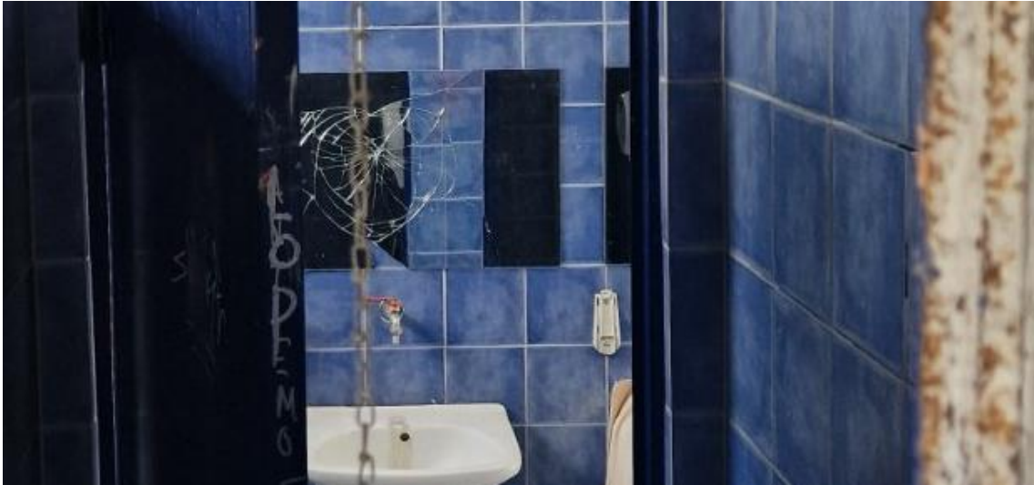
Εικ 5 Σπασμένος καθρέπτης που προήλθε από ρίψη πέτρας (όπως φαίνεται από το παράθυρο που στερείται υαλοπίνακα)

Αναμένουμε τη σχετική σας ενημέρωση για τις ενέργειες στις οποίες διατίθεστε να προχωρήσετε.