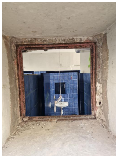
Εικ 3&4 Παράθυρα τουαλέτας που στερούνται υαλοπίνακα