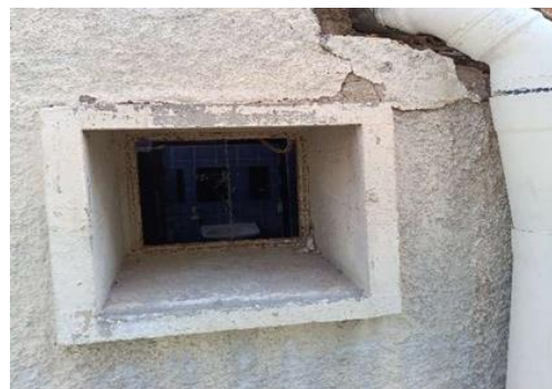
Εικ 2 Παράθυρο τουαλέτας που στερείται υαλοπίνακα