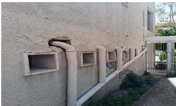
Εικ. 1 Τα παράθυρα των τουαλετών αρρένων από την πλευρά της εισόδου του κλειστού γυμναστηρίου

Ακολουθούν ενδεικτικές φωτογραφίες που αποτυπώνουν το προαναφερόμενο πρόβλημα: